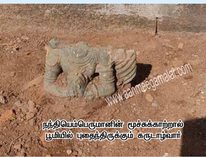
நந்தியெம்பெருமானின் மூச்சுக்காற்றால் பூமியில் புதைந்திருக்கும் கருடாழ்வார்

தேவியுடன் அருளுகிறார். ஸ்ரீ நந்திகேஸ்வரர் சந்நிதிக்கு எதிரில் நந்தியெம்பெருமானின் மூச்சுக்காற்றால் பூமியில் புதைந்திருக்கும் கருடாழ்வார் வீற்றிருக்கிறார். நான்கு நிலை இராஜ கோபுரத்துடன் அமைந்துள்ளது. இச்சிவாலயம்.